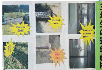
三年生の安全点検