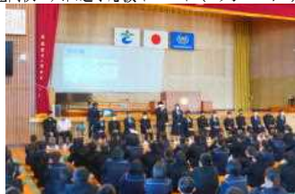
生徒会活動オリエンテーション(4月10日)