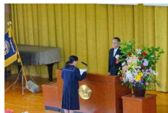
新入生徒の誓いの言葉