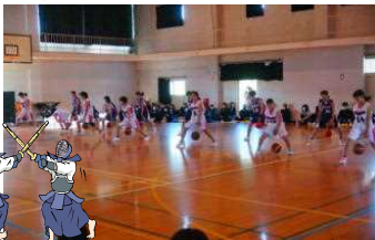
部活動オリエンテーション(4月10日)