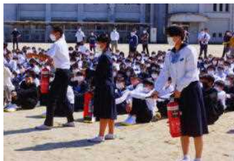
避難訓練(地震→火災)