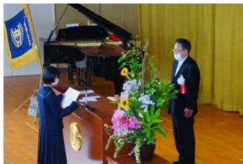
入学式(生徒代表誓いの言葉)