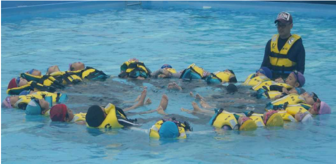
「水辺の安全教室」【6月22日】

教育委員会の薩摩教育係の先生をお招きして、海や川で自分や友達が危ない目に遭った場合の対処法について、実技を交えて詳しく教えていただきました。水中では、洋服を着ている時の不自由さや安全に助けを待つ方法など、子どもたちにも分かりやすく御指導くださいました。水辺に行かなくても、大雨で用水路の水が溢れることもありますので、水の危険性について詳しく学ぶよい機会となりました。