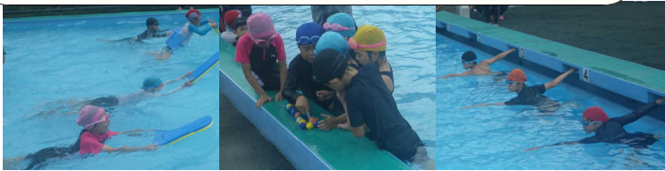
より速く、より遠くに「校内水泳大会」【7月7日】

子どもたちは、この日のために、自分の目標に向かって、全力で練習してきました。水が怖かった子どももいましたが、今では潜ることもできるようになりました。高学年は、水泳特訓の成果もあり、新記録も3つ誕生しました。保護者の皆様の声援が背中を押してくださいました。あたたかい御声援、ありがとうございました。