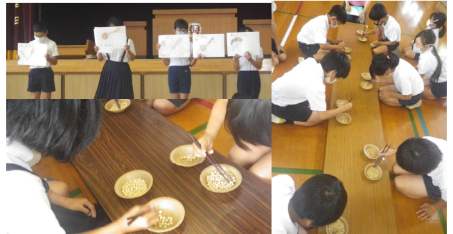
「豆つかみ大会」【7月2日】

全校保健集会で、保健・美化委員会の子もたちが、箸の持ち方や食事のマナーについて紹介しました。その後、1分間で大豆をいくつつかめるかを競い合う豆つかみ大会を行いました。正しい握り方でないと、なかなか豆をつかむことが出来ずに、苦戦する子どもたちもいたようでした。ゲームを通して、箸の握り方やマナーについて楽しく学ぶなかつ子でした。3、4年生が一番上手に豆つかみが出来ました。