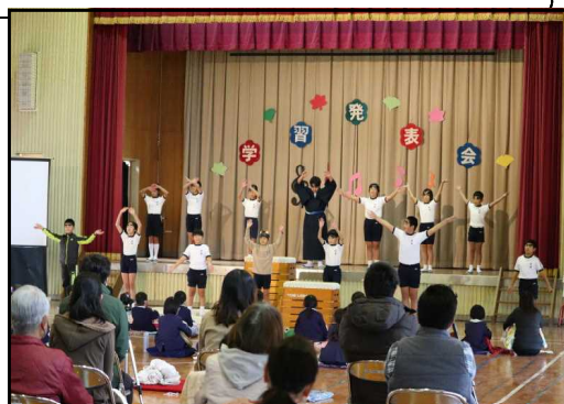
5・6年生の発表の様子

正に上の「開発的生徒指導」を目指した取組となりました。このような充実した取組ができたのも、学校で職員が取組を進めると共に、保護者の方々が趣旨を理解し、各ご家庭でも取組を進めていただいた結果だと思えます。今後、子どもたちと一緒に現在の姿をしっかりと見つめ直すと共に、目標やそれに向けた具体的な努力事項を再度確認し、2学期のまとめと締め括りに向けた取組の充実に努めていきたいと思えます。