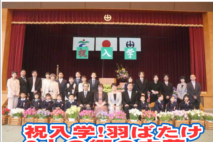
祝入学!羽ばたけ 9人の郷の力芽